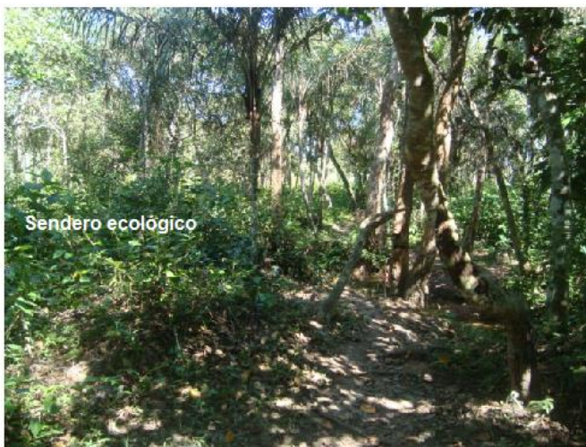
Flora Parque urbano Ecológico.

El imperativo de la demanda comunal fue generar espacios que protejan y promuevan en la población una cultura ecológica y contar con un lugar para la recreación y esparcimiento familiar. Se trataba de desarrollar una alternativa de alto potencial pedagógico, didáctico y recreativo para estudiantes, familias y turistas, que buscan un lugar de descanso y de conocimiento de la biodiversidad. Se buscaba establecer y crear un espacio donde los habitantes de Ascensión y sus visitantes, pudieran desarrollar actividades deportivas, recreativas y de esparcimiento, enfocadas en el desarrollo integral de la familia.