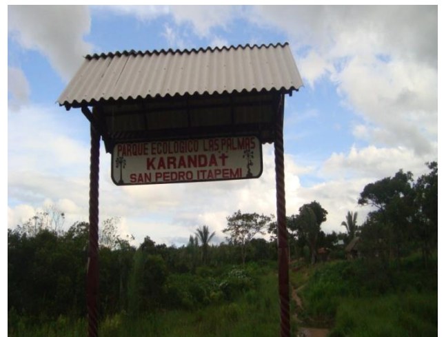
Sendero Ecológico. 2013.