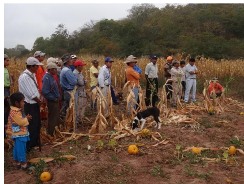
Asamblea comunal.