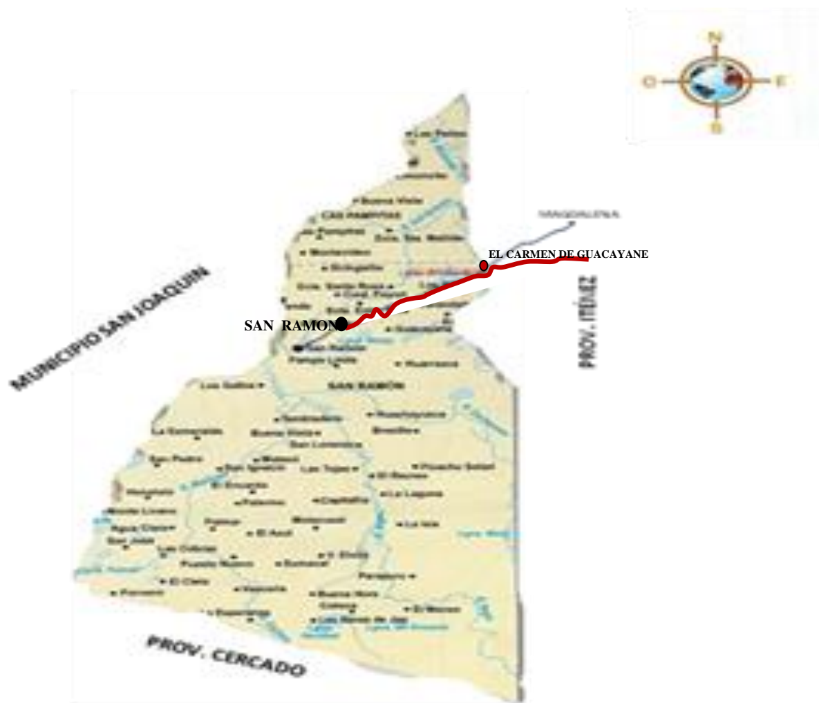
Figura 4. Localización de la Comunidad El Carmen de Guacayane en el municipio de San Ramón (Fuente: Equipo Editorial Visual Ediciones, 2012).