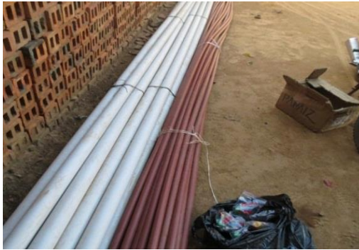
Material para instalación de la red