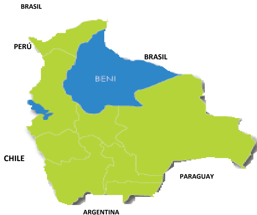
Figura 2. Localización del departamento Beni en el mapa de Bolivia (Fuente: Equipo Editorial Visual Ediciones, 2012).