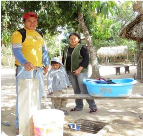
Distribución de agua a nivel domiciliario