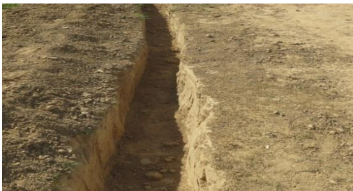
Excavación para instalación de la red